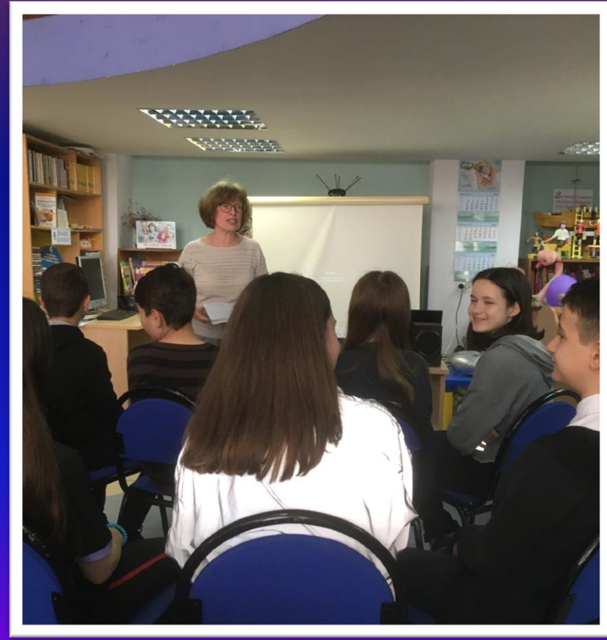
Участники 6 «В» класс